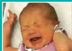
Je me fâche